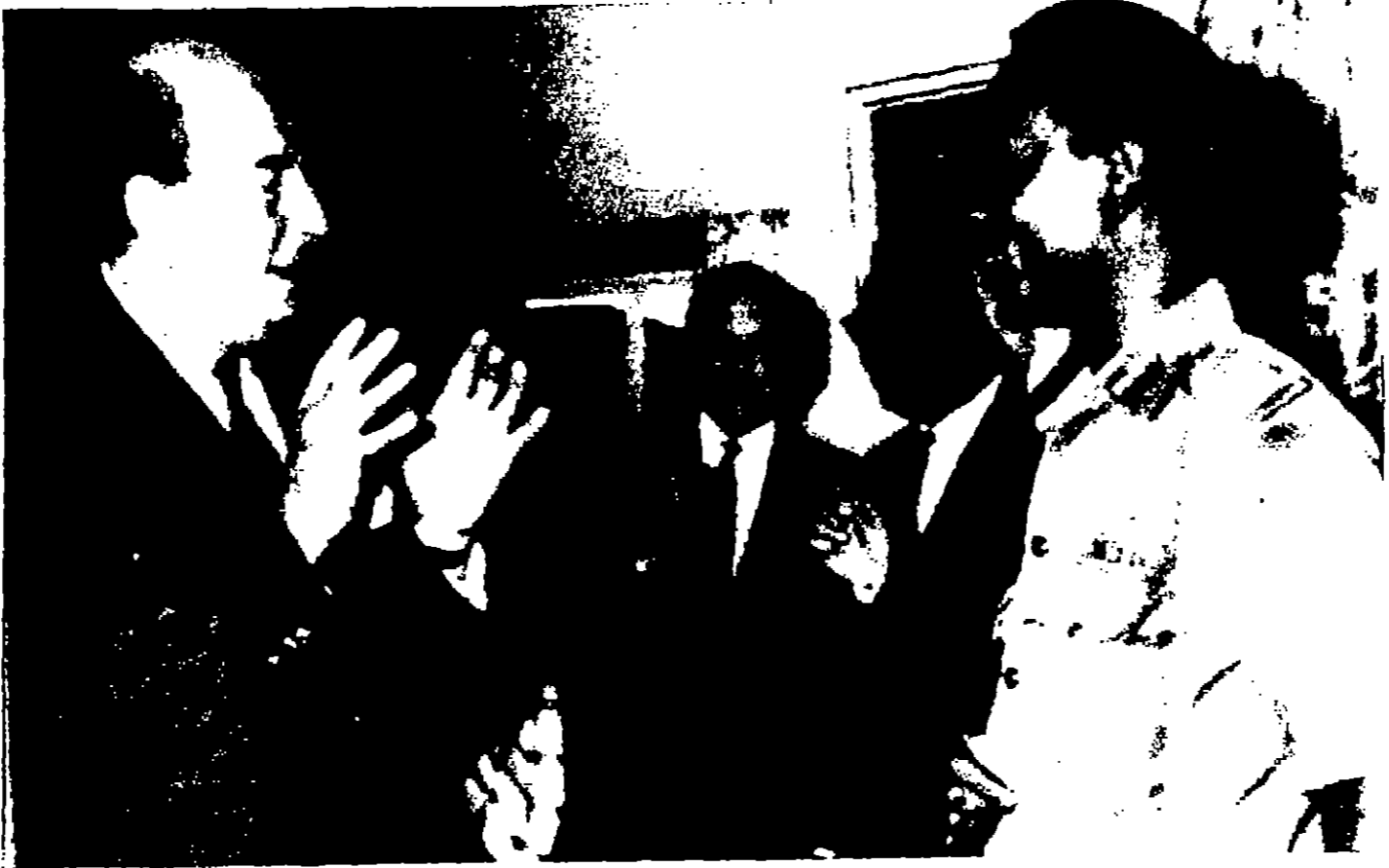
المرشد شريف البريطاني يبحث الى القائد العسكري الحاكم تجديرا الاتحادية الجنرال يعقوب غورون الى اليمن في لقاء الحرب مع مقاطعة بيلورا. وقد قدم القوي البريطاني الى غورون رسالة خاصة من المستر هارولد ويلسون رئيس الوزارة البريطانية